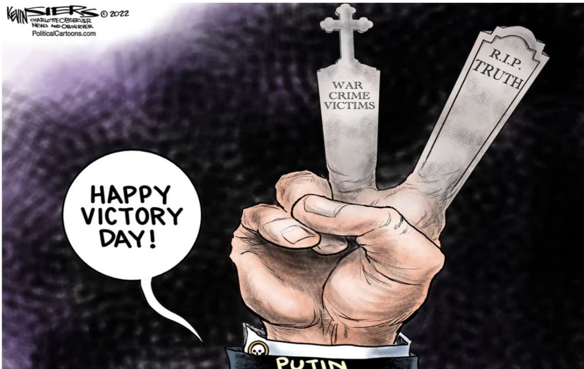
(Politico, 14 мая [впервые опубликовано в The Charlotte Observer, 9 мая])