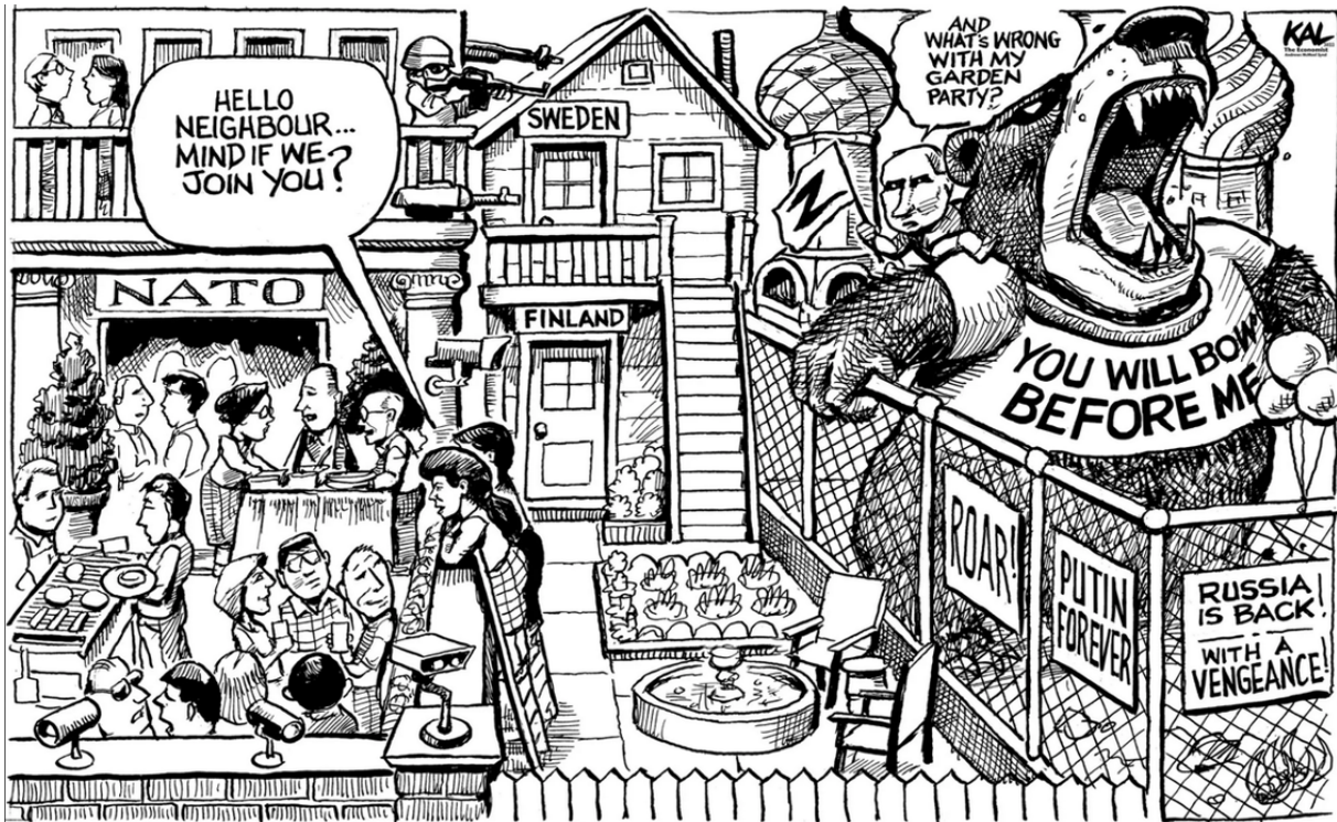
(Politico, 14 мая [впервые опубликовано в The Economist], 14 мая)